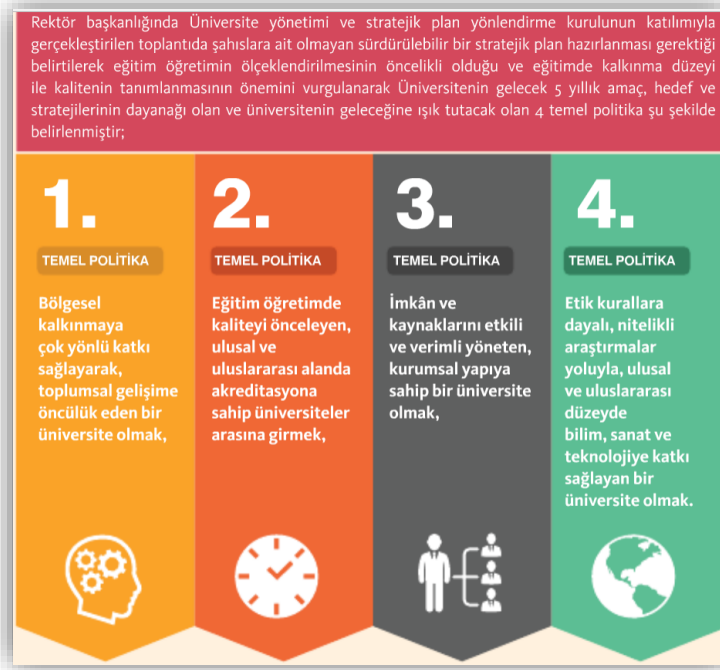
Şekil 2. Kırşehir Ahi Evran Üniversitesinin 4 Temel Politikası

vizyon, temel değerler ve amaç-hedefler oluşturulmuş ve kurum içerisinde personele duyurulması sağlanmıştır.