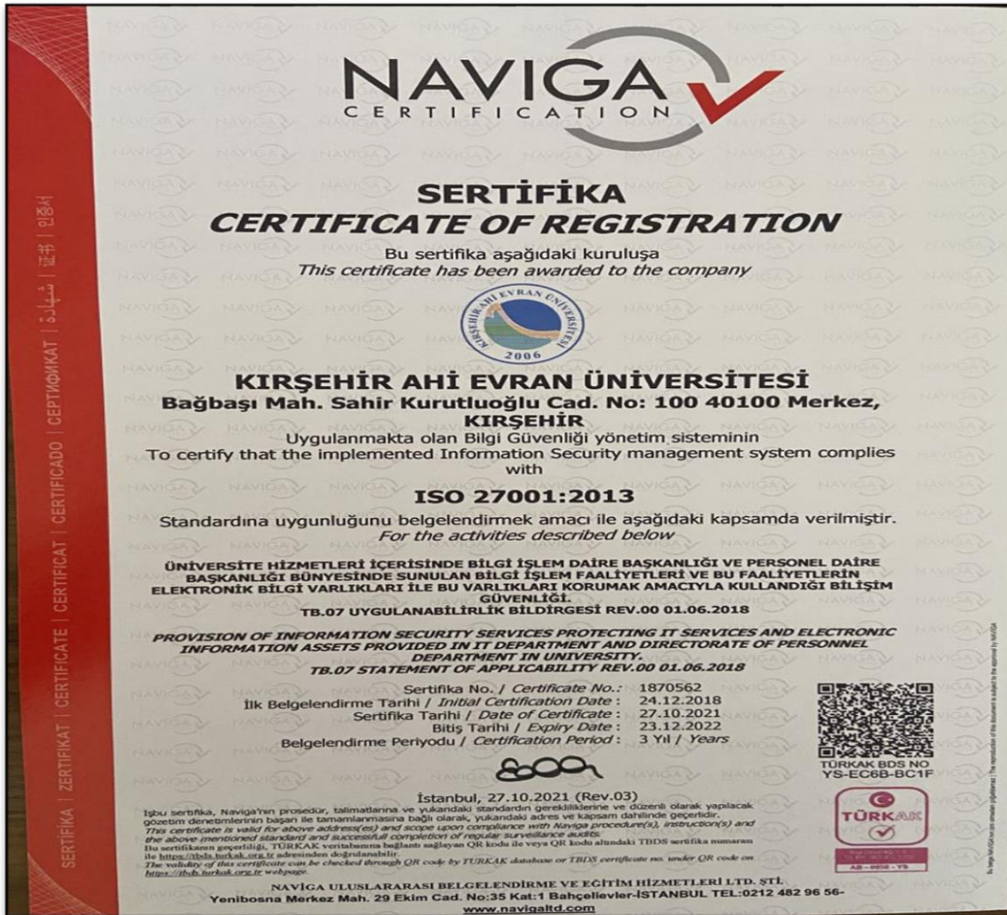
Şekil 2: Bilgi Güvenliği Yönetim Sertifikası